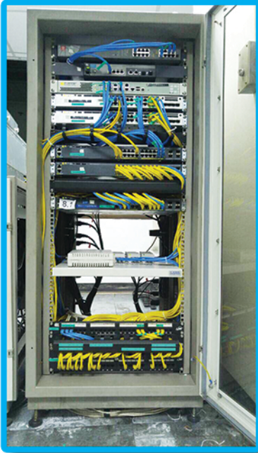
ห้องเซิร์ฟเวอร์ ถูกไฟไหม้บางส่วน สามารถแก้ไขได้ ด้วยทีมงานของเรา

สอดคล้องกับงบประมาณขององค์กร งานแบบนี้แหละที่เราถนัด เราพร้อมพาคุณไปให้ถูกทาง เพียงแค่เปิดโอกาสให้เราได้นำเสนอ เปรียบเทียบสินค้าให้เห็นชัดๆ ไปเลยว่า แต่ละ Vendor ได้ออกแบบผลิตภัณฑ์ของตัวเองมาแล้ว เหมาะหรือไม่เหมาะ อย่างไร ก็องค์กรของคุณ