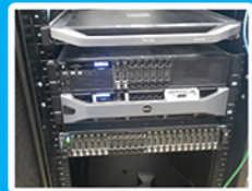
VMware vCenter Installation