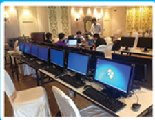
VMware Horizon View Installation