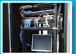
Terminal Service / Remote Desktop Service