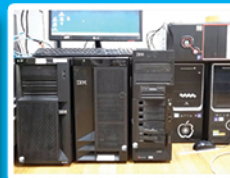
Windows File Server Installation