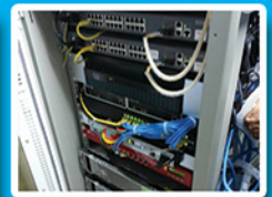
VMware ESXi Installation