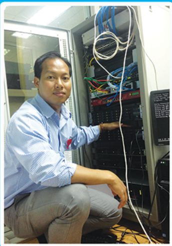
งานติดตั้งระบบที่ บริษัท Hokkaido Milk